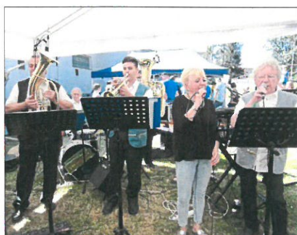
Musik beim Fest gab es auch.