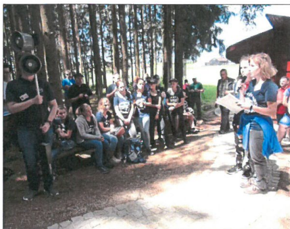
Bei der Begegnungs- und Besinnungsstätte erzählten Mädchen die Legende von der Jakobsmuschel.