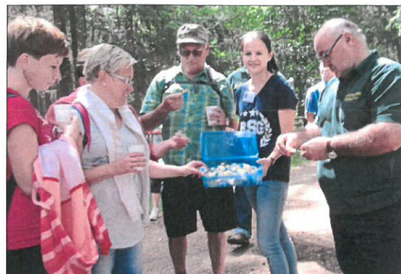
Als Erinnerungsgeschenk an den schönen Tag verteilten Gymnastinnen Muscheln an die Pilger.