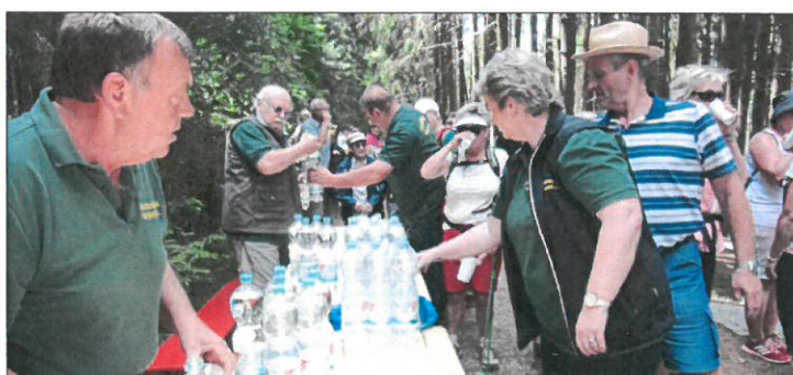
Gerne nehmen die Pilger die Getränkestation der Seugenhofer Schützen an.