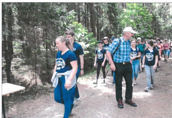
Die Gymnasiasten führten den Zug an.