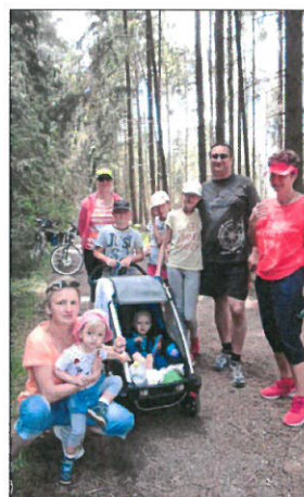
Eine tschechische Familie nahm mit den Kleinsten teil.

Die Muschel dient aber weiterhin, am Gehstock oder Gewand befestigt, als Erkennungszeichen und