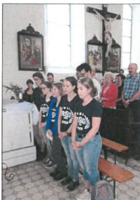
Selbstverständlich feierten die Jugendlichen die Messe mit.