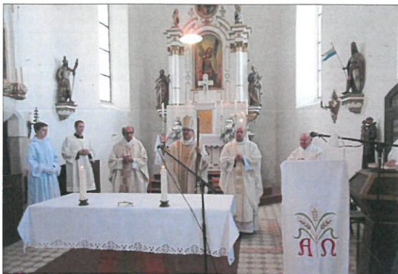
Bischof Hulob segnet am Ende des feierlichen Pontifikalgottesdienst die Gläubigen.